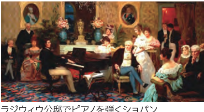
ラジウィウ公邸でピアノを弾くショパン

能的な必然のような気がしてならない。弦楽器奏者にとって、響かない嬰ハ短調のなかで、開放弦と共鳴するナポリIIIはひときわ深々と響くのである。意外なことに、ショパンはベートーヴェンの《月光》ソナタをレパートリーにしていた。ヴィルヘルム・フォン・レンツはこう証言する。「ベートーヴェンといえば、ショパンによる嬰ハ短調(Op.27-2)と変イ長調(Op.26)のソナタの演奏はじつに独特で[...]絵というよりはむしろデッサンを描いているようだった」ショパンの嬰ハ短調の名曲「ゴッダネズ第1番Op.26-1、ノクターン第7番Op.27-1などに聴かれる印象深いナポリIIIには、彼の潜在意識に染み込んだ《月光》ソナタの余韻を聴く思いがするが、極めつけはプレリュード 嬰ハ短調Op.45。序奏からナポリIIIに度肝を抜かれるこの小品は、最終移ろい浮遊する和声ごとりわけ幻想的な音響を描き出す意欲作で、ベートーヴェン生誕75周年を記念したメケッティ社のチャリティー楽譜「ベートーヴェン・アルバム」に収録されている。